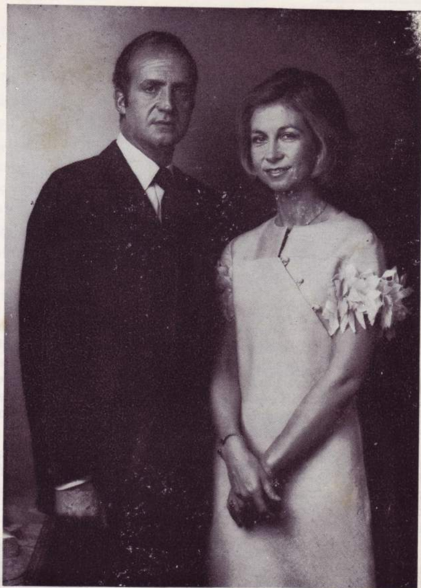
S.S. M.M. LOS REYES DE ESPAÑA