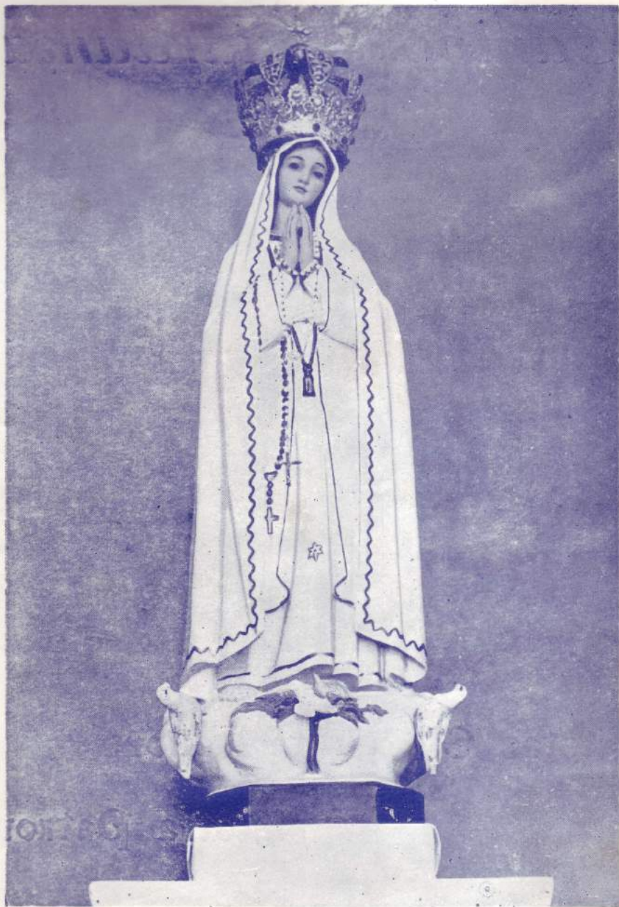
Ntra. Sra. de fátima Patrona del Campo de Guardamar