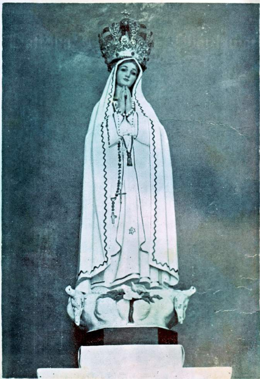
Patrona Campo de Guardamar