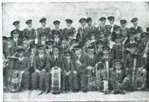
La magnífica Banda Municipal de Guardamar del Segura, contratada por nuestra hoguera