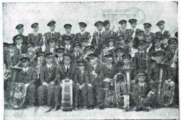
La magnífica Banda Municipal de Guardamar del Segura, contratada por nuestra hoguera